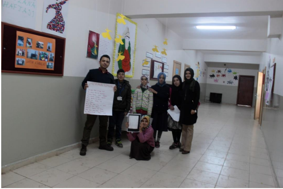
TABLO 8 : Özel Eğitim

Kurumumuz ile yakın olan Kamu Kurum ve Kuruluşları ile iletişim halinde bulunarak desteklerini alabilmek.