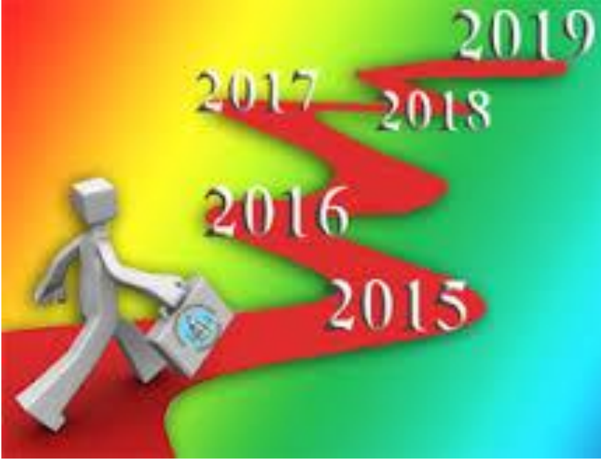
Şekil 1 : 2015-2019 Stratejik Plan Temaları